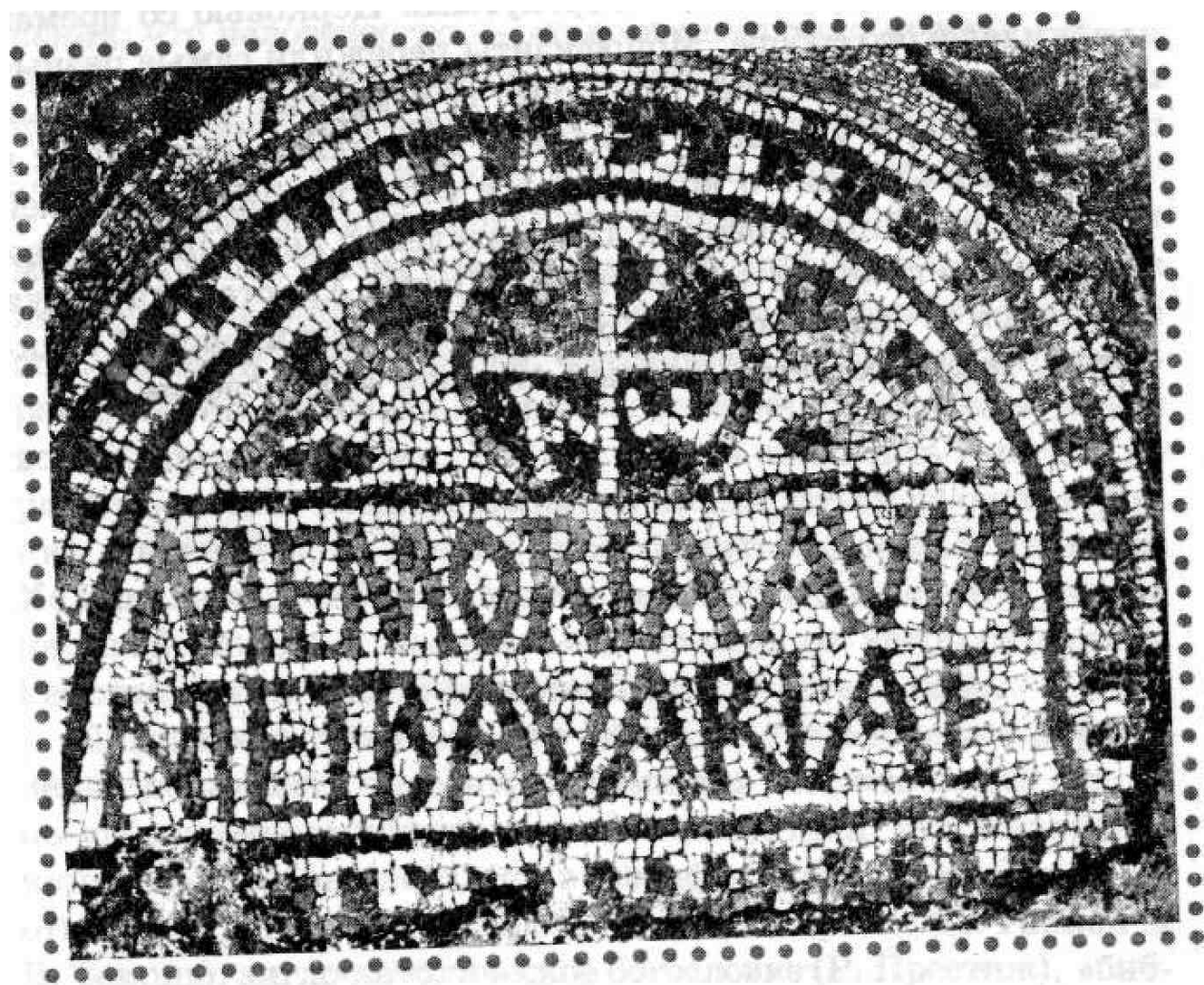
Халкидонский собор (451 г.). Мозаика в храме Святого Исаака в Константинополе (И.). Реплика. Святые отцы всех соборов

В последние годы библеисты немало сил тратят на изучение исторических вопросов, в частности на поиск истоков веры и Самого Иисуса. В связи с этим величайший теолог современности К. Ранер заметил, что лишь сейчас Церковь начинает понимать халкидонский принцип «полноценного человечества» Христа. Экуменические переговоры заставили богословов искать общее между теми, кто исповедует две сущности, и монофизитами, отвергнутыми Церковью со времен Халкидонского собора. Монофизиты пережили самые разные формы государственного устройства и многих чужеземных захватчиков, и уже один этот факт заставляет задуматься: а является ли учение о количестве и соотношении сущностей Христа достойным поводом для разделения церквей? Все они черпают свет Божий через того же Иисуса Христа, исповедуя Его Богом и Человеком. Что же касается халкидонской трактовки, то она остается важным вкладом в богословие.