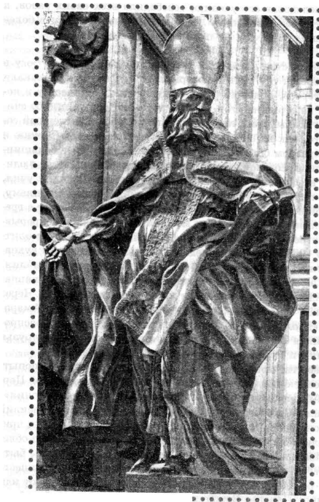
Джанлоренцо Бернини. Святой Августин Аврелий