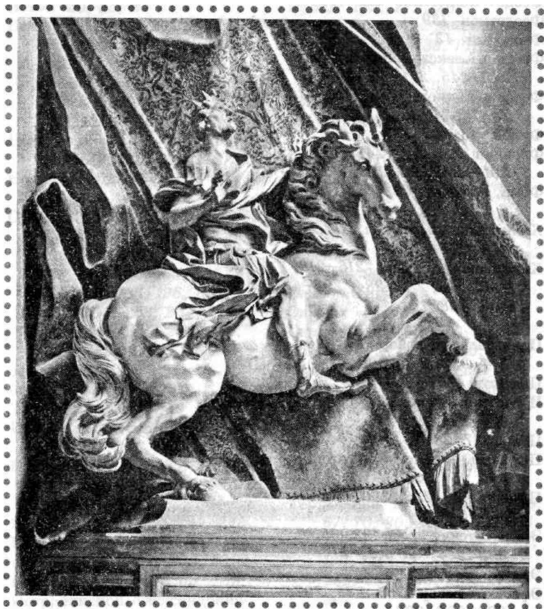
Джанлоренцо Бернини. Перелом в жизни Константина.