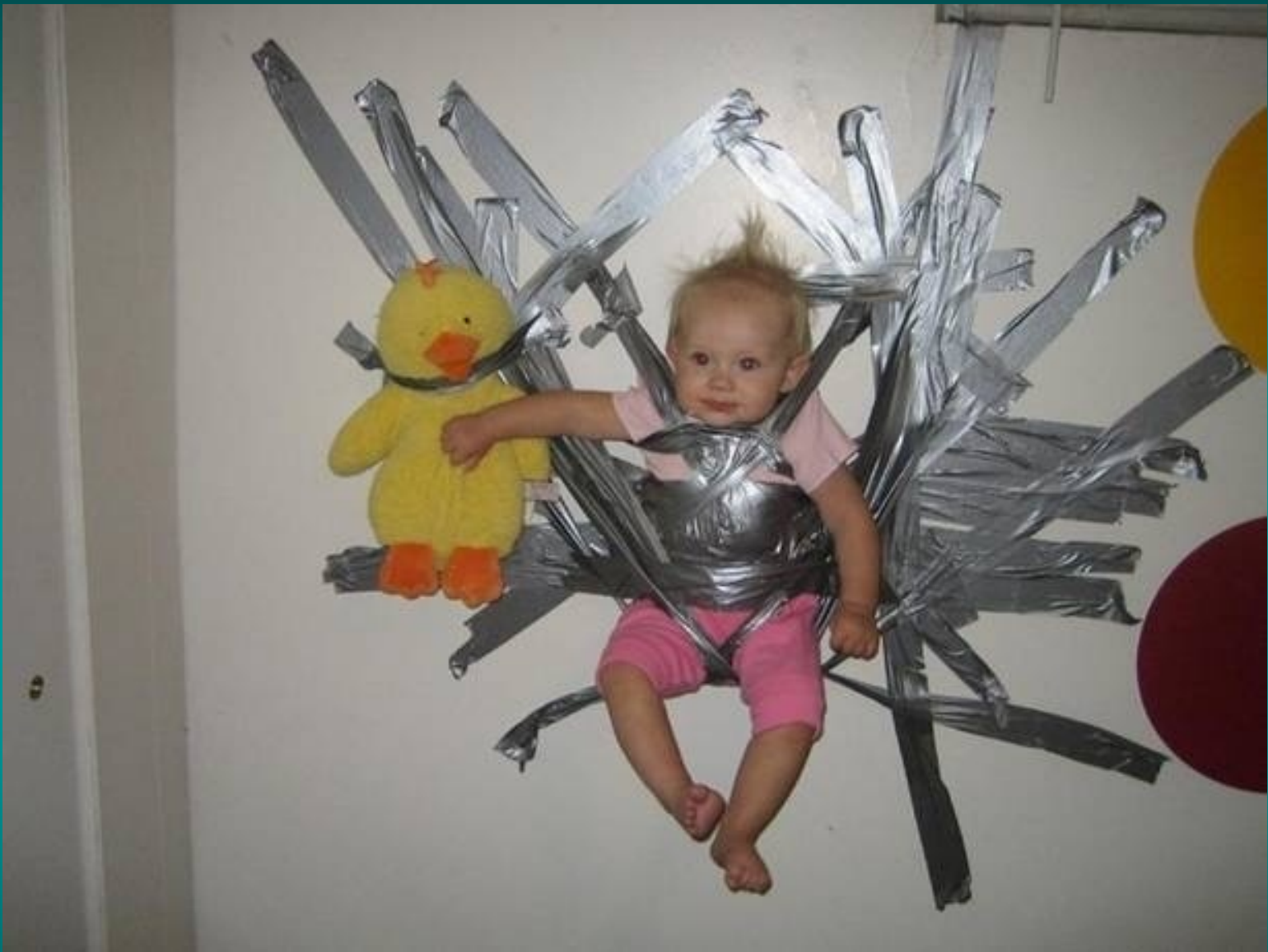
Baby Sitting Man Style